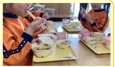
幼稚園・中学校 3割支援