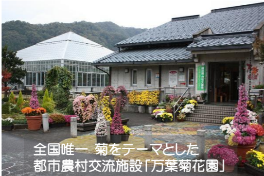
全国唯一 菊をテーマとした 都市農村交流施設「万葉菊花園」