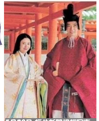
5月29日 福井新聞掲載写真 大河「光る君へ」撮影開始