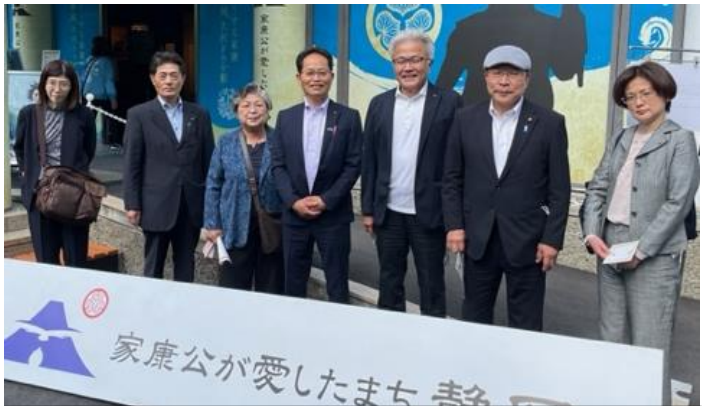
大河ドラマを生かした観光誘客をテーマに、静岡に視察 市議会産業建設委員会