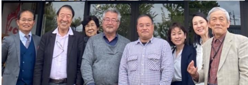
有機栽培の原料で作っている味噌の「マルカワ味噌」の川崎社長を訪問