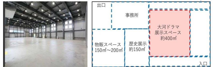
大河ドラマ館「まさかりどんの館」の内部・室内レイアウト