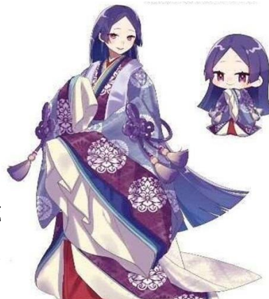
紫式部のキャラクター